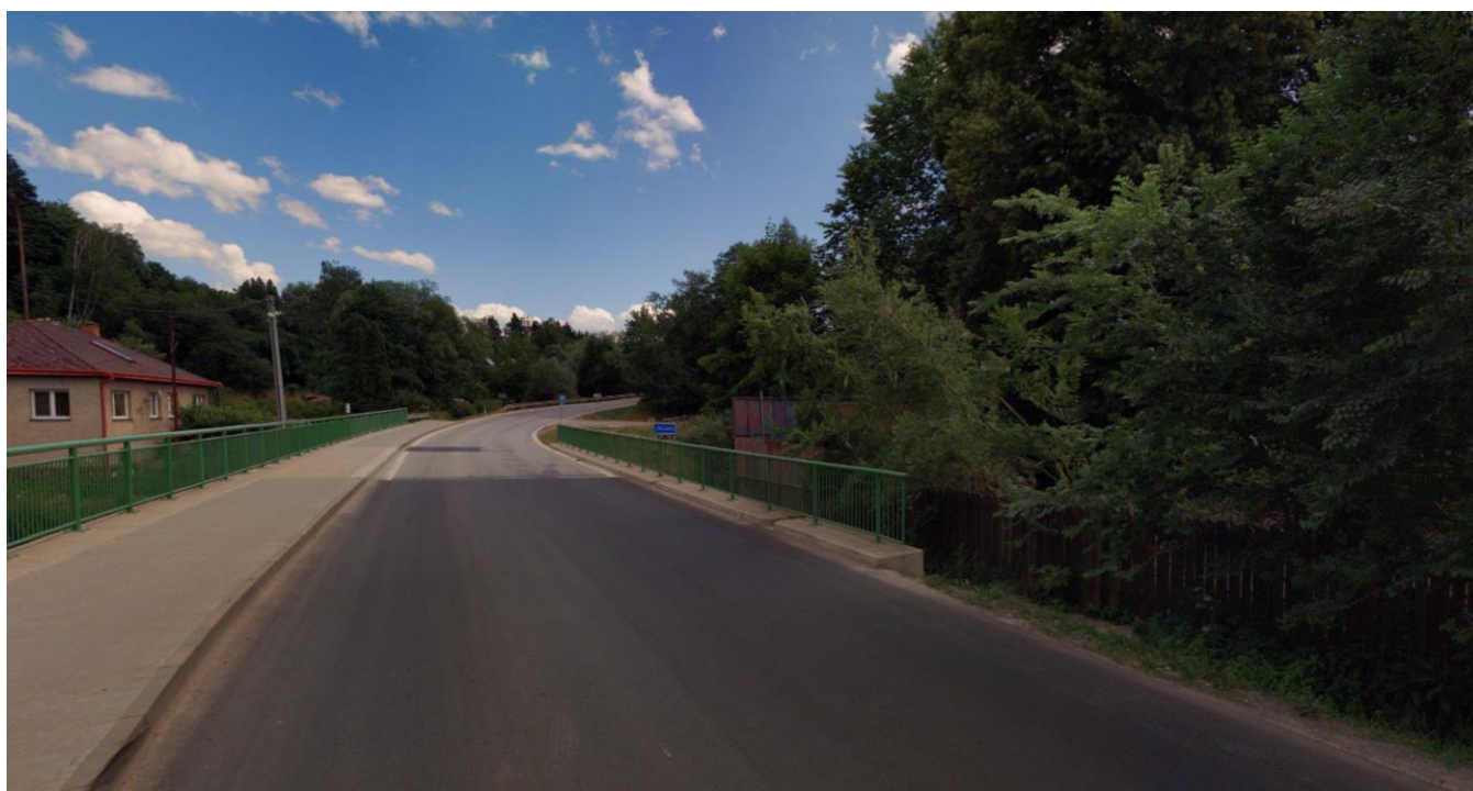
Pohled směrem z města, vpravo podél mostu vyústění kanalizace směrem do řeky