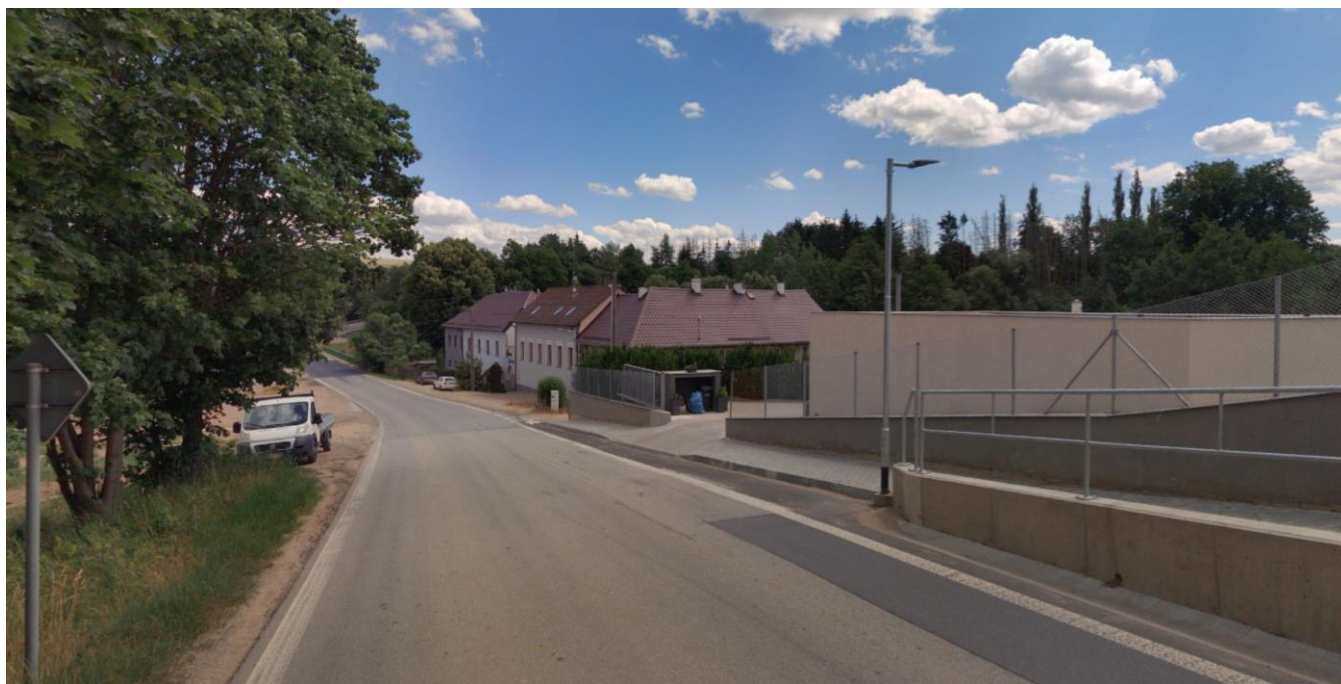
Pohled směrem z města, vpravo konec stávajícího žlabu