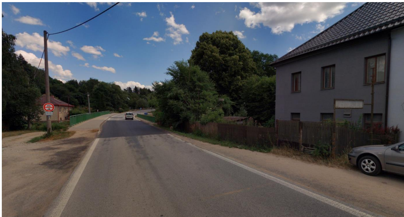
Pohled směrem z města, vpravo bude vedena nová kanalizace