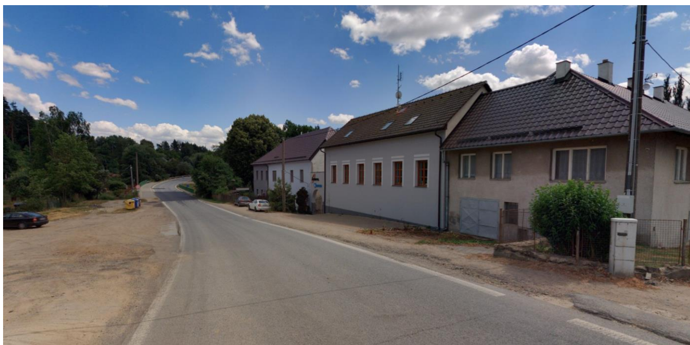
Pohled směrem z města, vpravo bude vedena nová kanalizace